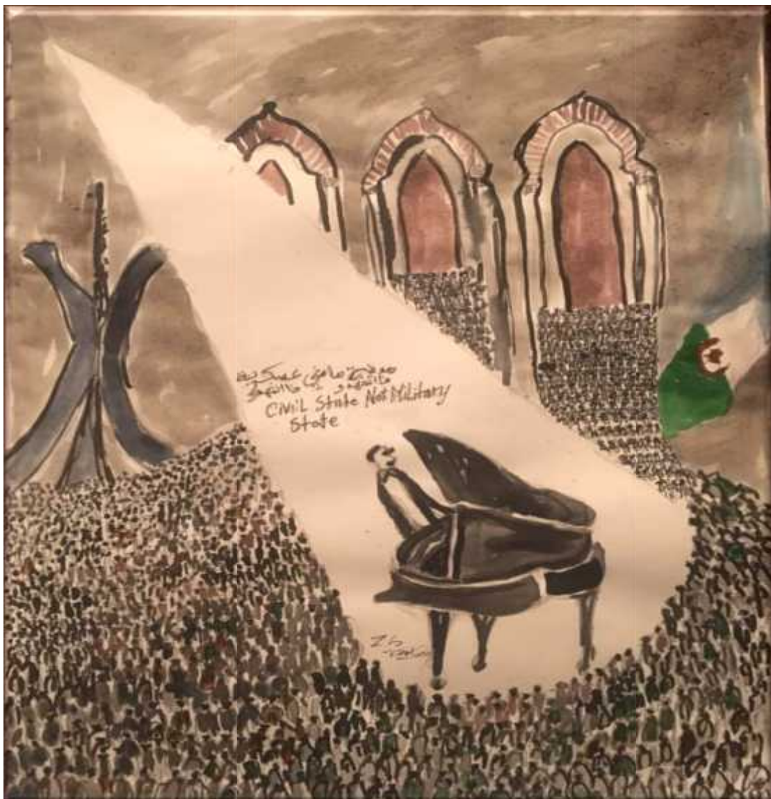
« Une peinture dessinée par l'artiste peintre Zineb Sjahsam le 03 Mars 2020 »