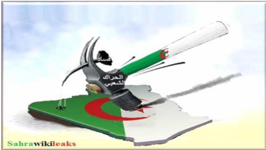
Image n°4 : Un portrait trois (3) D exprime l'état du mouvement contestataire ;

Le deuxième est ; " Le pouvoir = سلطان ", son signifié est la catégorie qui nuit à l'Algérie et elle en a profité.