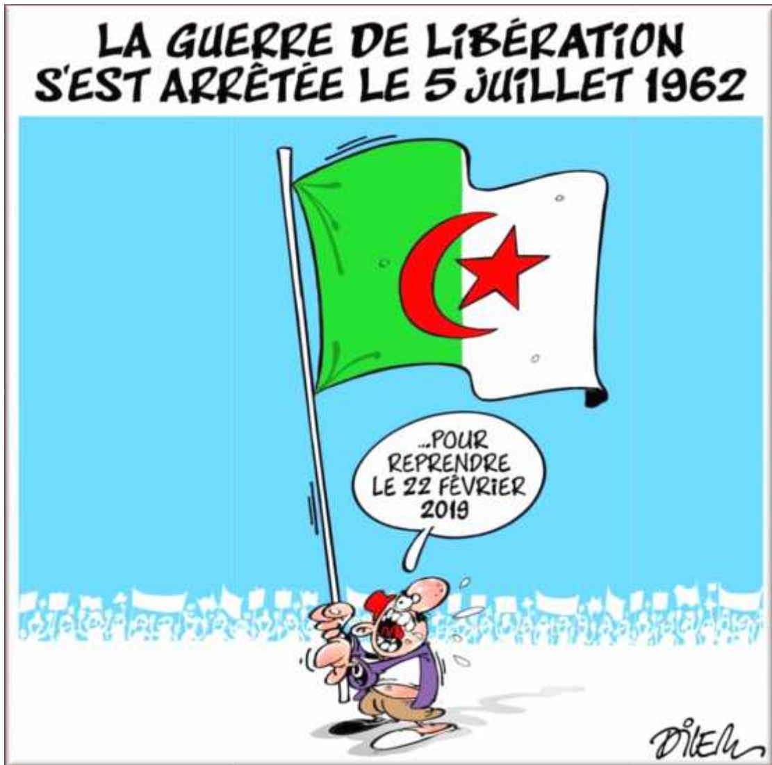
Image n°5 : Une caricature algérienne représente le HIRAK Algérien ;

« Caricature du dessinateur Dilem pour le journal Liberté parue le 01 Mars 2019 »